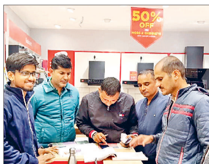
रोहतक। चालान की कार्रवाई करते हुए नगर निगम की टीम।

सफाई व अतिक्रमण से जूझता रोहतक आमजन का साथ पाने में निगम विफल