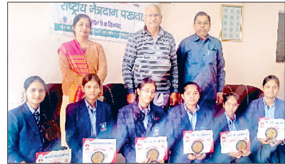
रोहताक। विजेताओं को सम्मानित करते भारत विकास परिषद शाखा के सदस्य।