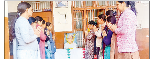
शिक्षा भारती विद्यालय में भाऊ देवरस को नमन करते शिक्षक।