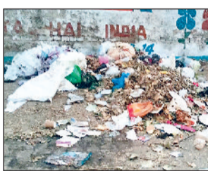
हरिभूमि न्यूज रोहतक

कूड़ा प्रबंधन में भी लोगों का साथ नहीं मिल रहा